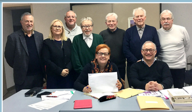
9 des 12 membres du Conseil d'Administration national

De plus, les dates et le lieu de notre prochain congrès national ont été arrêtés. Il se tiendra